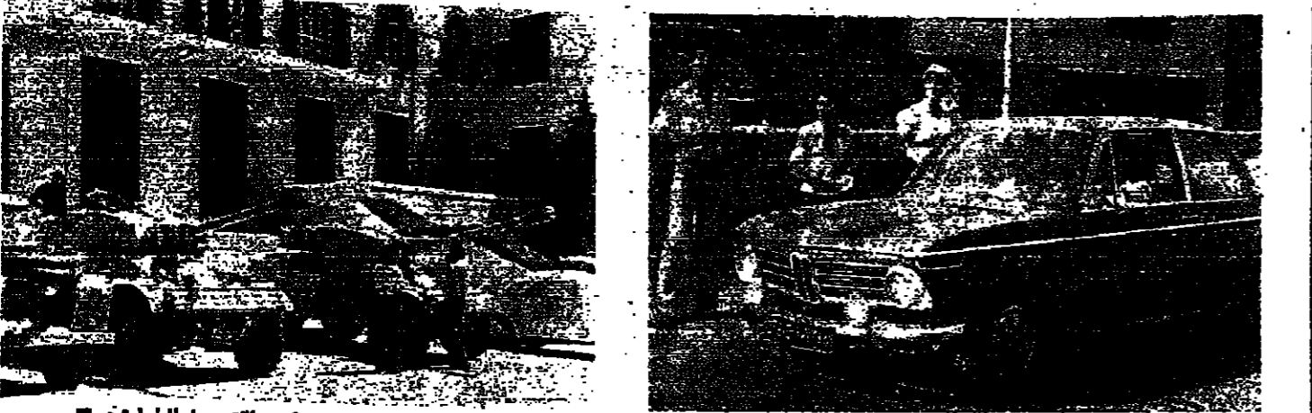
مستحقان توابان امام سيرة زحلة تحسبا للطوارئ

وقالت: ان كل مخلص في هذا البلد لا بد ان يتحسس لدعوة المجلس النسائي للتفاني في العمل على الفاء كل اسباب التحرر في الداخل والخارج على تحقيق الطموح الوطني، ولا سيما طلب العدالة الاجتماعية المحروقة في هذا البلد، وفي جيل لبنان دولة عصية على حيلة لا يكون فيها من مجال لاتصال اي اختلاف طائفي او قروي بل دولة عصية تجعل الطائفة في مستوى الخيالة، ويحكم على الطائفة كسبا يحكم على القاتل، والاعدام، فكأنما كان القتل جريمة تروى بحكم عليها بالأعدام فان الطائفة لجريمة جارية